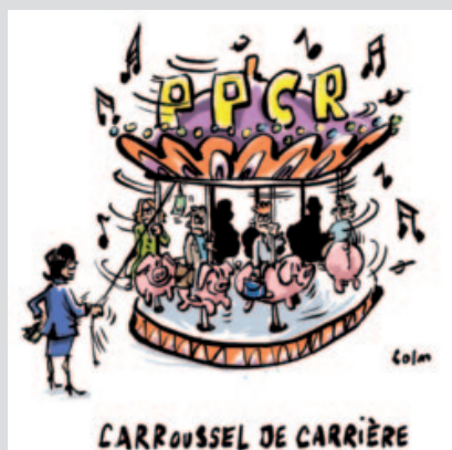
Grille des PE jusqu'au 31/08/2017

Vous trouverez ci-dessous un tableau détaillant le rythme de passage d'un échelon à l'autre ainsi que les anciennes grilles d'avancement. ■