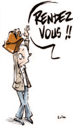
RENDEZ-VOUS DE CARRIÈRE

“ Aujourd'hui, j'ai reçu l'appréciation finale de l'IA-DASEN : « Satisfaisant » alors que ma note d'inspection est de 18/20 et que dans le tableau il y avait coché (4 satisfaisants – 6 très satisfaisants et 1 excellent) et que l'appréciation de l'IEN était très bonne. Sur quels critères s'est-elle arrêtée ?